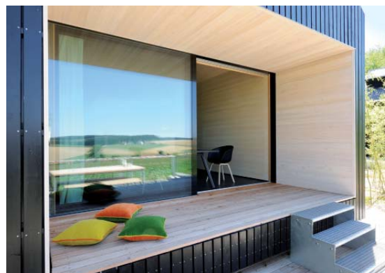
Außergewöhnlich und gänzlich unterschiedlich in Design und Ambiente sind alle 10 Häuser des Hofguts. Kindheitsträume erfüllt sich gar mancher Gast im kuscheligen Baumhaus, ein anderer fühlt sich im romantischen Bootshaus wohl, der nächste schätzt die klare Struktur der Langhäuser

Abendessen im Esszimmer im Haupthaus serviert wird, wird mich Rita, die quirlige Physiotherapeutin im Hofgut, noch zu einer Massage abholen.