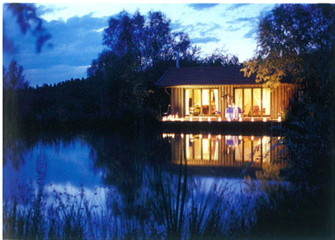
Jeder Gast wohnt im eigenen Haus am See: das „Hofgut Hafnerleiten“ in Bad Birnbach

Im lichten, immer wieder runderneuertem Haus auf der Hügelkuppe des Kurbereichs kann man gut urlaube, je nach Gusto im gemütlichem Landhausstil oder in moderner Möblierung. Manche Doppelzimmer verfügen über eine Schlafgalerie, ein Tipp für Hochzeiter ist die „Honigmond-Suite“ mit Himmelbett, offenem Kamin und freistehender Badewanne. Auf 2500 Quadratmetern findet man Thermalpool, Whirlpool und Beauty, nach Wunsch auch mit Heilkräutern. Im Restaurant gibt es bayerische, österreichische und mediterrane Gerichte, etwa Rehbockrücken mit Pfifferlingsrisotto und Zucchini, in der „Ofenstube“ Regionales wie Rahmschwammerl mit Brezenknödel. Sehr gutes Frühstück mit vielen Produkten aus der Umgebung.