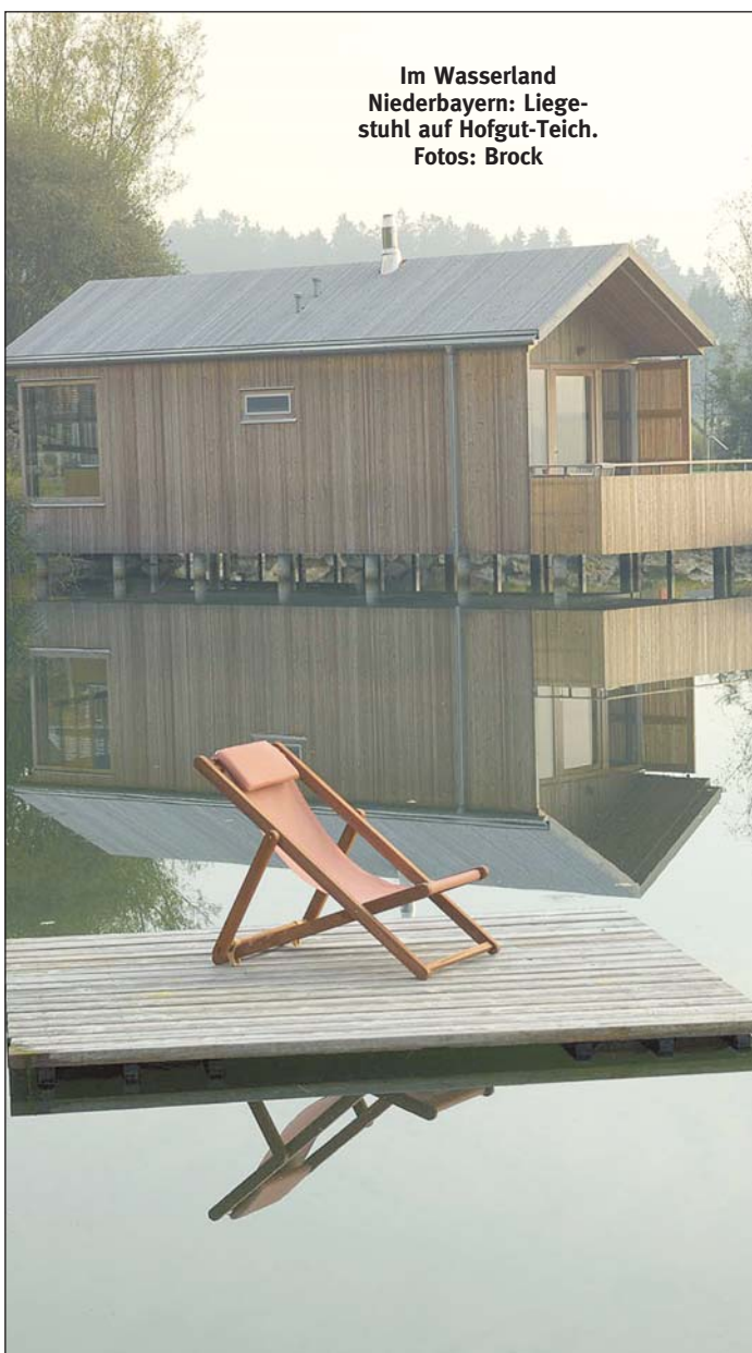
Im Wasserland Niederbayern: Liegestuhl auf Hofgut-Teich.

Wer Teichsuiten zu einer Besonderheit seiner Beherbergung kürt, der ordnet auch dem Wasser eine spezielle Bedeutung zu. Wasser, stellen Horn und Rückler fest, wirke beruhigend; für die Hofgut-Gäste sei es unabdingbar. Und: Wasser steht im Grund auch am Anfang der Bad-Geschichte von Birnbach. Obwohl gegen Ende der 1930er-Jahre in der Nähe zunächst nach Erdöl gebohrt wird. Statt darauf, erzählen die Birnbacher, stößt man am Ende jedoch auf Thermalwasser. Und weil die damalige Reichsregierung es so verfügt, muss die Bohrung wieder zugeschüttet werden. Erst 1973 startet der zweite Versuch - und am 21. September wird in rund 1700 Metern