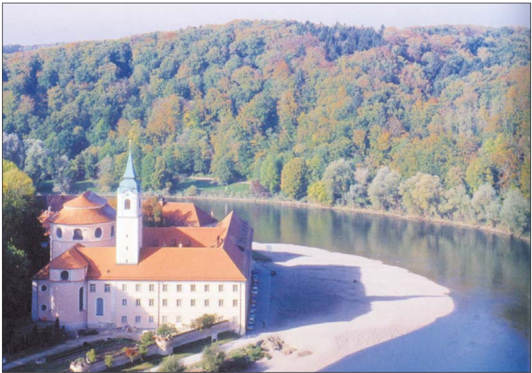
Lohnendes Ausflugsziel: Abtei Weltenburg am Donaunaudurchbruch.