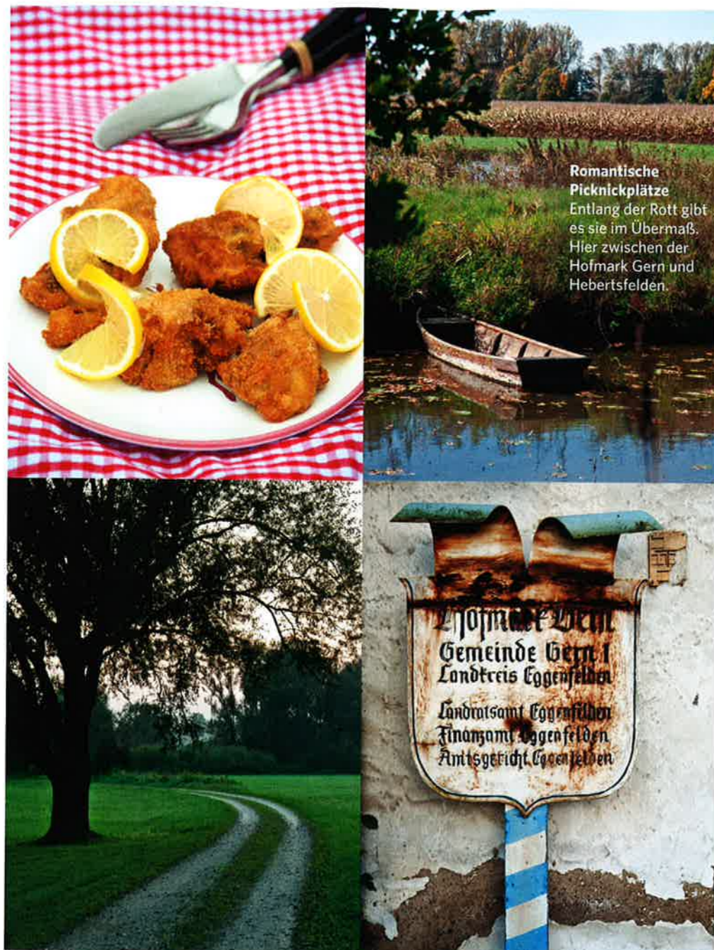
Romantische Picknickplätze Entlang der Rott gibt es sie im Übermaß. Hier zwischen der Hofmark Gern und Hebertsfelden.

Hofmark Gern Gemeinde Gern | Landkreis Eggenfelden Landratsamt Eggenfelden Finanzamt Eggenfelden Amtsgericht Eggenfelden