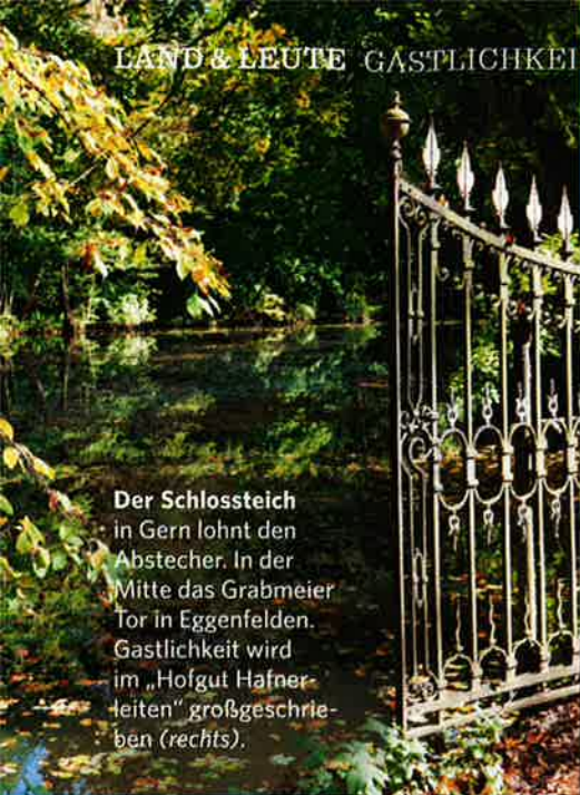
Der Schlossteich in Gern lohnt den Abstecher. In der Mitte das Grabmeier Tor in Eggenfelden. Gastlichkeit wird im „Hofgut Hafnerleiten“ großgeschrieben (rechts).