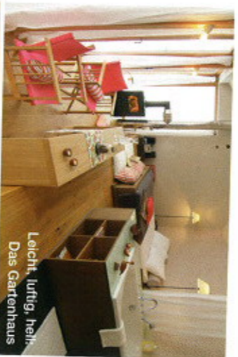
Leicht, luftig, hell: Das Gartenhaus